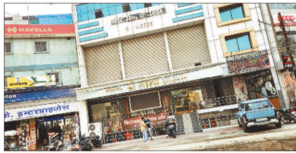
सरफा दुकान जहां से टगी की गई।

सभी अतिथियों के द्वारा 'अनुभव' का विधिवत शुभारंभ क्यू आर कोड का रिबन खोलकर किया गया। इस दौरान इससे संबंधित एक वीडियो प्रेजेंटेशन भी दिखाया गया, जिसमें 'अनुभव' के उपयोग और उपयोगिता के संबंध में जानकारी साझा की गई। आज से ही यह व्यवस्था रेंज के सभी जिलों के सभी थानों में पारस कर दी गई है। इस अवसर पर शहर के गुणगान्वा नागरिकजन, सभाज सेवी संस्थाओं के लोग उपस्थित थे।