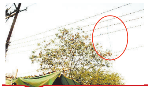
लालखदान क्षेत्र में हुकिंग कर की जा रही बिजली की चोरी।