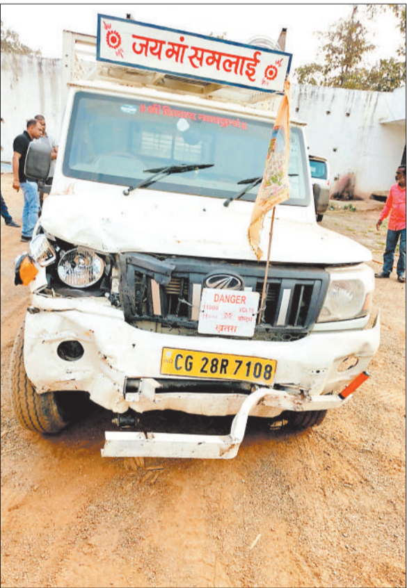
वह पिकअप जिसने बाइक को टक्कर मारी।