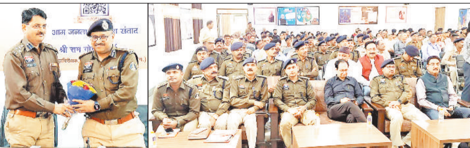
आईजी का स्वागत करते एसएसपी।